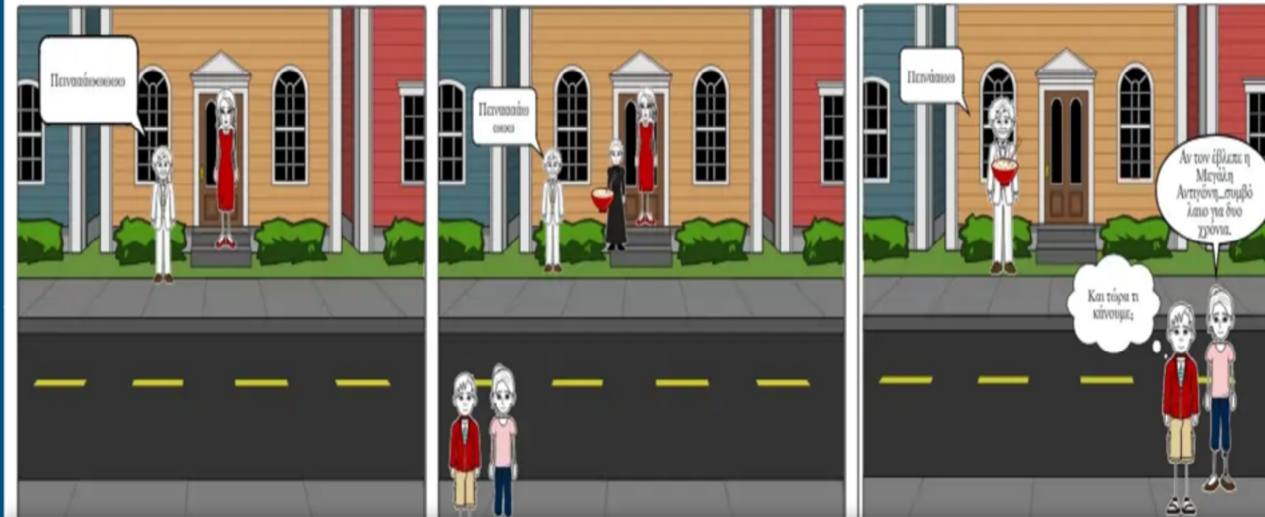
Ο περίπατος του ζωντανού παππού