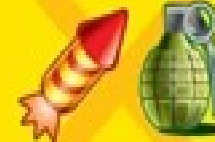
Εκρηκτικές Ύλησι / Explosives