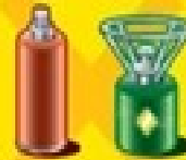
Αέρια / Gas

PLEASE REMOVE DANGEROUS GOODS FROM YOUR HAND LUGGAGE AND BAGGAGE