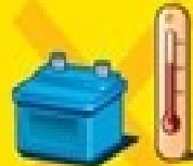
Διβρωστικές ουσίες / Corrosives